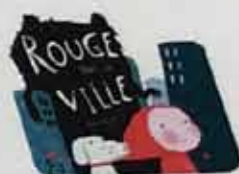
Red in the City