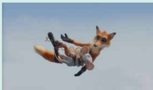
Mus og ræv i den syvende himmel Distribution: Angel Films