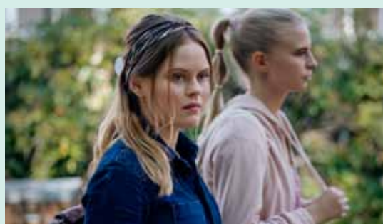
Smuk Distribution: SF Studios

Vær opmærksom på læremidler på mitCFU.dk med relation til forårets film: