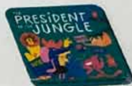
The President of the Jungle

Look at the book cover - what does it make the class think of? Hand out A3 prints of the book and post-its to the groups. The children write vocabulary and small texts on post-its.