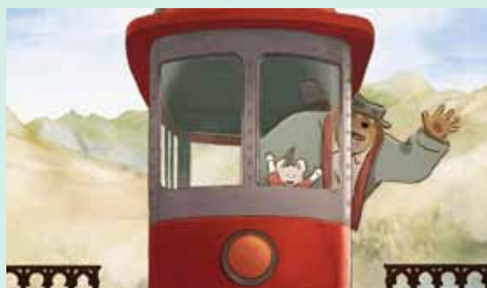
Ernest & Celestine – rejsen til Vrøvlistan Distribution: Scanbox