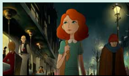
Hvor er Anne Frank?